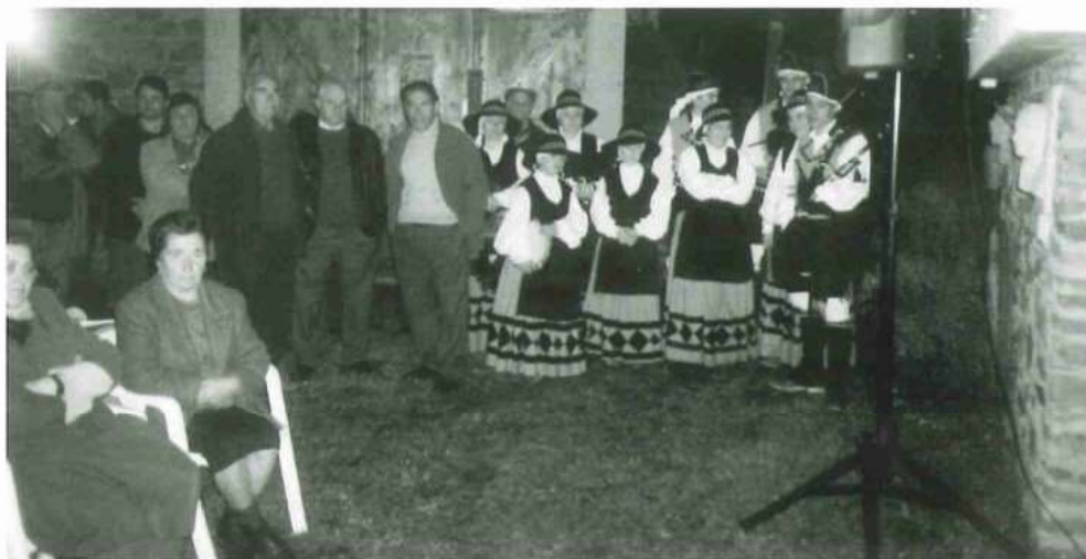
GRUPOS DE GAITAS NA HOMENXE ÓS GAITEIROS DE PILOÑO NA SOLAINA

Menos piadosas pero non por iso menos necesarias, eran as romarías que organizadas daquela polos mozos, podían contratarse para animar as noites festivas. Non acostumaban rematar máis tarde da unha da madrugada agás a romaría de “Hoy Vas” que sempre remataba no luscofusco. Nestes casos, os gaiteiros compartían recital xunto coas “músicas” así chamadas daquela ás bandas de música actuais que, formadas por 10, 15, 20 ou 25 músicos, repartían de forma alterna as intervencións. A banda tocaba tres pezas facía un descanso e os gaiteiros tocaban tamén tres temas. A vantaxe de contratar ós gaiteiros, residía principalmente no seu económico prezo e na innecesaria autorización ou permiso da Garda Civil para poder tocar.