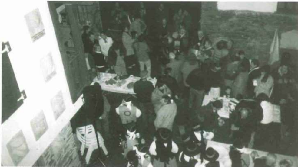
PÚBLICO ASISTENTE NA SOLAINA Á HOMENAXE ÓS GAITEIROS DE PILOÑO

Perdido o contacto co aramio guía que une ámbalas dúas beiras do río como único vieiro que vencella a terra coa vida, a barca perde autonomía e como unha mortífera cesta de vimbios gobernada por unha tripulación de homes desesperados, pérdese na escuridade, batendo corpo con corpo entre os saloucos húmidos e desesperados duns homes que tentan resucitar dun final que xa non ofrece dúbidas.