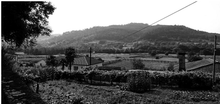
Fig. 1. As chairas fluviais do Ulla dende a igrexa de Ledesma. As desiguais condicións fisiográficas ó norte e sur do río Ulla foron determinantes no desenvolvemento da batalla

máis escabroso e resolto en tramos fluviais encaixados sobre unha sucesión de numerosas celas montañosas que complican visual e topograficamente o relevo. Así, as tropas galegas tiñan unha vantaxe diferencial, pois podían achegarse á Ponte Ledesma ao tempo que parapetarse e fragmentarse, a modo de varios exércitos, en distintas partidas próximas entre si. Pola súa parte, os franceses tiñan que apostarse nunha gradaría mais tendida e aberta, utilizando as ladeiras altas e medias dende as que a artillería perdía poder e alcance. Así queda reflectido no combate do día nove de marzo, (Pardo de Andrade 1912b), cando os franceses necesitan facer descender as pezas de artillería e a infantaría ata as inmediacións da ponte ao non acadar a segunda das posicións locais no alto que media entre Ponte Ledesma e Ponte Cira, provocando finalmente a necesidade de levar a cabo unha emboscada por retagarda acubillados dende as alturas de Camanzo para interferir na axuda entre as distintas posicións galegas.