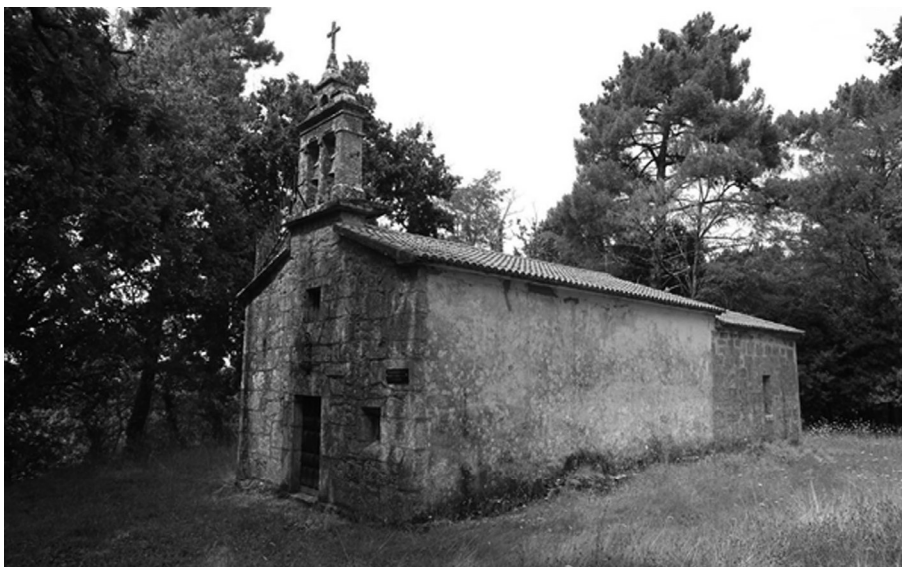
Fig. 3. A capela do Couto, adro e inmediacións foron escenario da reunificación das forzas galegas o día 9 de marzo en retirada para deliberar. O ataque definitivo parte deste lugar e comeza en Ponte Cira