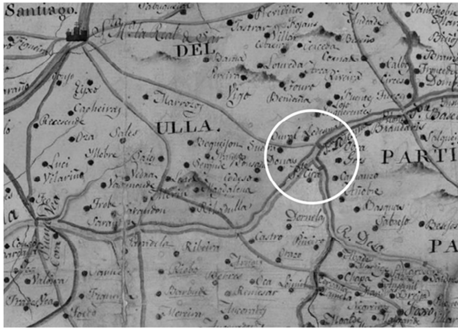
Fig. 2. O mapa da Antiga Provincia de Santiago dividido en 13 partidos, de 1812, pertencente ó “Mapa Geográfico del Reyno de Galicia”, permite entender a importancia estratéxica do dobre paso de Ponte Ledesma e Ponte Cira (círculo branco), mediante pontes estables, facilitando unha rápida conexión entre Santiago, Pontevedra e Ourense apoiados polas pontes de Carboeiro, Taboada e Pereiro.

A primavera de Trasdeza. Entre marzo e maio de 1809. Factores físicos e cronoloxía dos feitos bélicos asociados á batalla de Ponte Ledesma