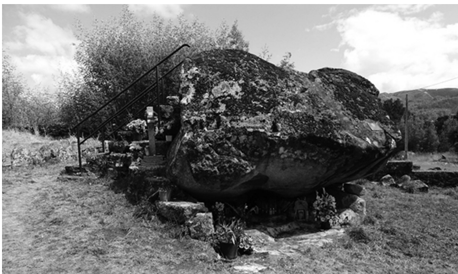
Fig. 5. A Penadauga, escenario da Xunta do 15 de marzo e lugar no que se atopa a importante paneira que avituallou ás tropas españolas